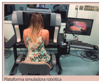
Plataforma simuladora robótica

HEADINGS: Robotic. Laparoscopy. Motor skills. High fidelity simulation training.