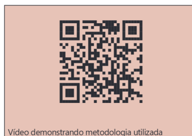
Vídeo demonstrando metodologia utilizada

O treinamento é uma parte importante do aprendizado cirúrgico. Simuladores são ferramentas valiosas para o aprendizado. Tanto os cirurgiões laparoscópicos, como principalmente os treinados apenas em cirurgia aberta, são incentivados a praticar em simuladores.